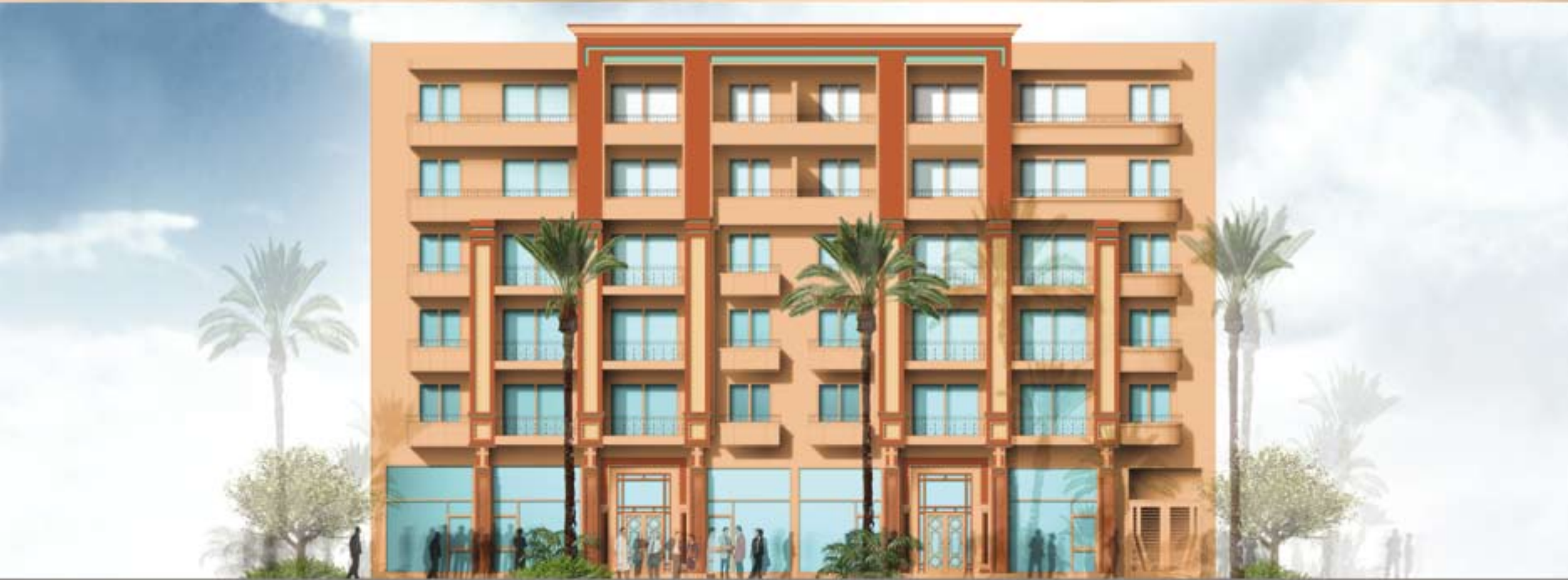
Façade Sur Rue Capitaine Arrigui